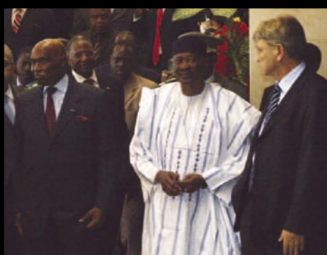
Le Président Wade, le Président Touré et Alain Madelin, les 3 acteurs de la rencontre de Bamako

La rencontre sur la solidarité numérique au service de l'éducation et du développement organisée à Bamako en janvier 2009 autour des chefs d'Etat du Mali et du Sénégal et des membres des gouvernements de nombreux pays africains a permis de présenter et de valider le projet Sankoré d'éducation numérique pour tous en Afrique.