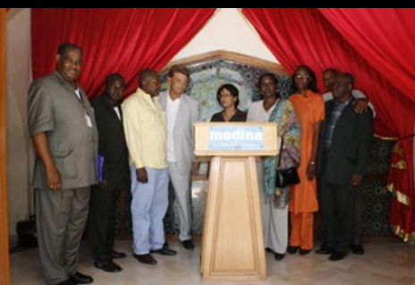
A l'issue de l'Université, la remise des premiers TBI aux délégations africaines

L'université numérique d'été organisée en Tunisie en août 2008 qui a réuni 18 délégations des ministères de l'éducation de pays africains francophones a marqué la naissance du projet d'Education Numérique pour Tous en Afrique.